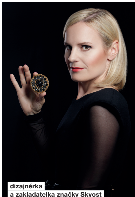
dizajnérka a zakladateľka značky Skvost